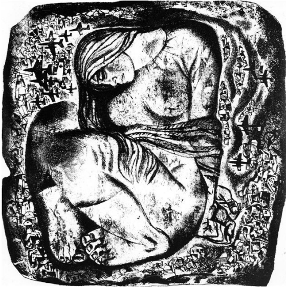
Г. Паплаўскі. «Чэрвень. 1941» з серыі «Памяць» (1968)