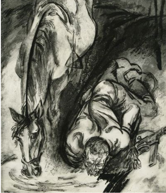
А. Кашкурэвіч «Смага» (1970)