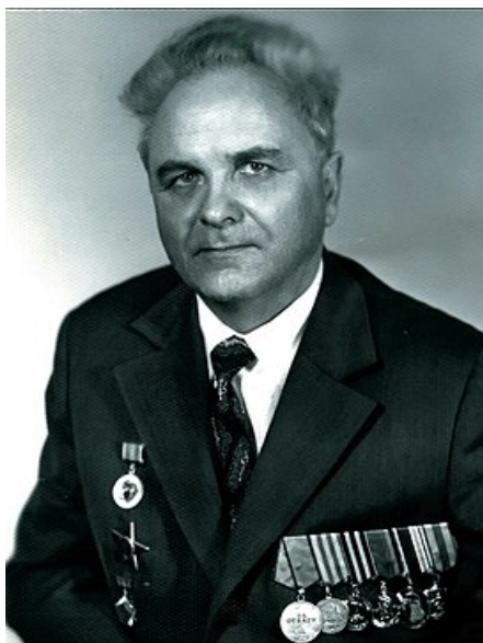
Лев Никитич Пушкарёв